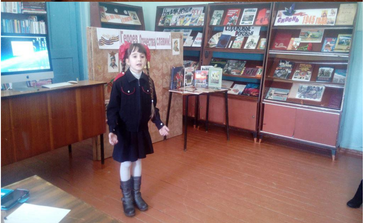
Конкурс чтецов «М помнит мир спасенный!»